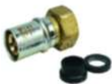
Avec écrou tournant